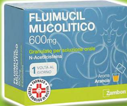
FLUIMUCIL MUCOLITICO 10 bustine da 600 mg