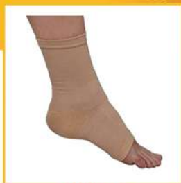
CAVIGLIERA CALZINO SOTTILE