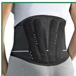
LOMBOGIB® LADY CORSETTO LOMBOSACRALE