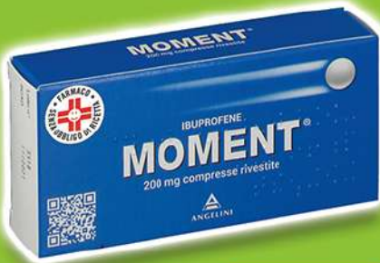
MOMENT 6 cp. - 200 mg

SPECIALE Catalogo N° 12 VALIDO DAL 4 NOVEMBRE 2019 AL 30 APRILE 2020