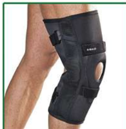
LIGAGIB® GINOCCHIERA ARTICOLATA