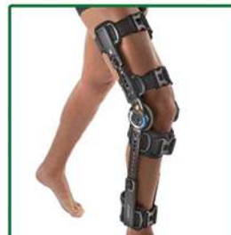
INNOVATOR DLX®+ TUTORE DI GINOCCHIO