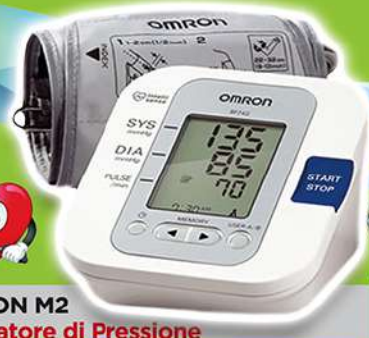
OMRON M2 Misuratore di Pressione