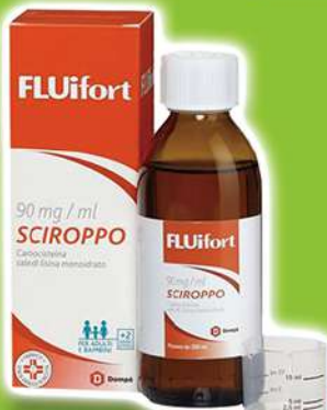
FLUIFORT 90mg/ml Sciroppo mucolitico 200 ml