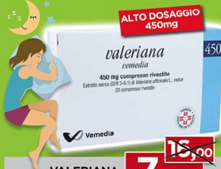
VALERIANA 20 cp. - 450 mg