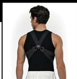
K1 POSTURE KEEPER® RICHIAMO DINAMICO DORSALE DA UOMO