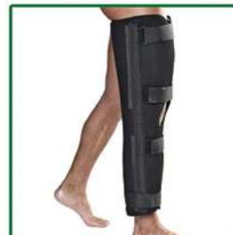
ZEROGRADI® GINOCCHIERA POSTOPERATORIA