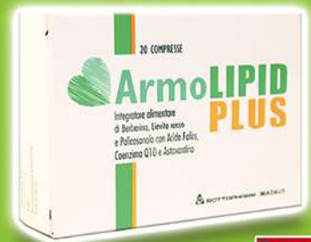
ARMOLIPID PLUS Integratore alimentare 20 cp.