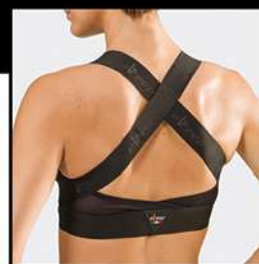
B1 POSTURAL BRA® REGGISENO POSTURALE