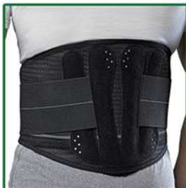
LOMBOGIB® WORK CORSETTO LOMBOSACRALE