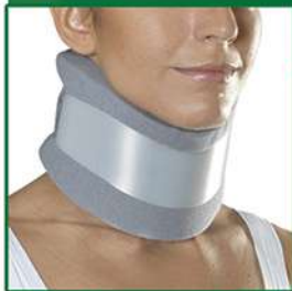
COLLARE CERVICALE SEMIRIGIDO MEDIO