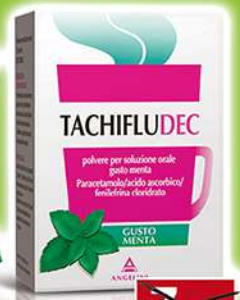
TACHIFLUDEC 10 bustine gusto menta