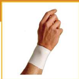
POLSINO COTONE PAIO