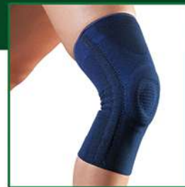
ARTIGIB® GINOCCHIERA LEGAMENTI