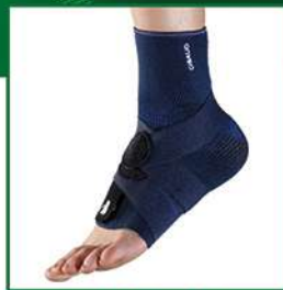
MALLEOGIB® CAVIGLIERA LEGAMENTI