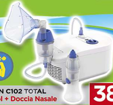
OMRON C102 TOTAL Aerosol + Doccia Nasale