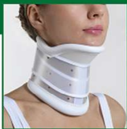
COLLARE C3 con MENTONIERA