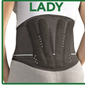
CORSETTO LOMBOSACRALE LADY